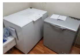
13 refrigerators, freezers, etc.