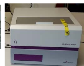
Fluostar Omega for prions