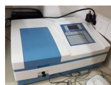
UV Photo- meter