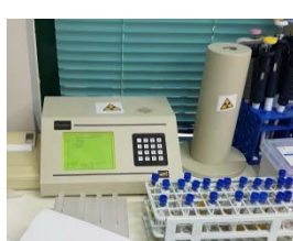
2 \gamma -counters