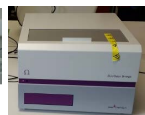
Ανακινούμενο φθορισμόμετρο - μικροπλάκων Fluostar Omega